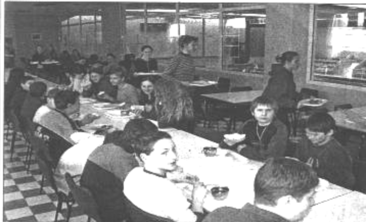
DA SE KROZ GODINU DVJE MALI ROMI NI PO ČEMU NE BI RAZLIKOVALI OD SVOJIH VRŠNJAKA HRVATA I UVIJEK BEZ SUSTEZANJA MOGLI SJESTI ZA JEDAN STOL